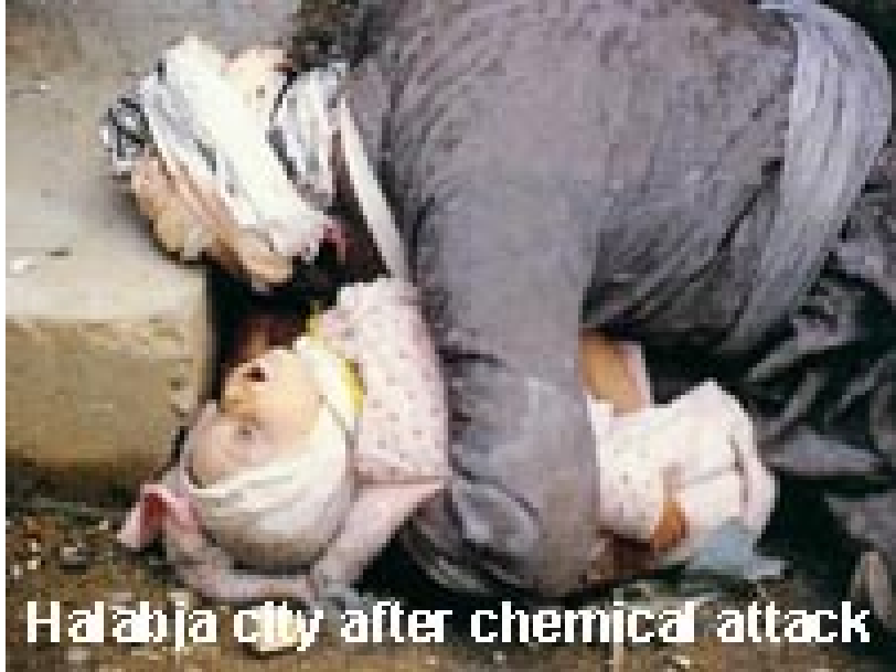
Halabja city after chemical attack